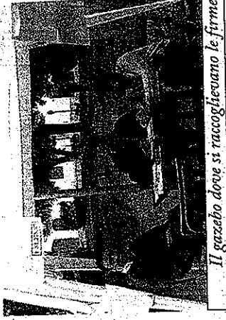
Il gazebo dove si raccoglievano le firme